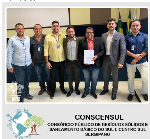
Imagem 01: Reunião de Entrega do PMI na AGRESE.

Para isso, serão realizadas as Audiências Públicas para a apresentação do PMI nº 005/2018, que serão realizadas nos dias 15/07/2022 - 8h00 às 12h00 (Sala Virtual), 22/07/2022 - 8h00 às 12h00 (Sala Virtual), 29/07/2022 - 8h00 às 12h00 (Sala Virtual), 05/08/2022 - 8h00 às 12h00 (Presencial com local a definir pela comissão), a qual deve garantir a contribuição, não só de técnicos, mas também de pessoas que convivem diretamente na região e que vivenciam a problemática de resíduos sólidos em seus municípios.